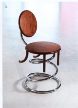
5. Sedia in libertà LUCA SACCHETTI